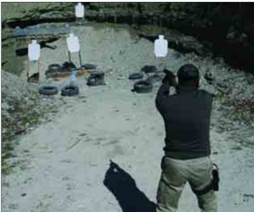
Un appassionato di armi si allena nella cava delle Cesane