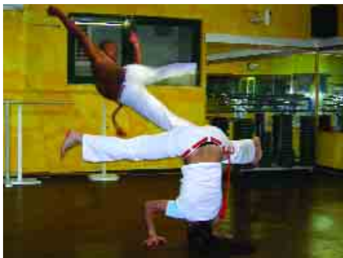
Un momento dell'allenamento del gruppo Ginga Rio