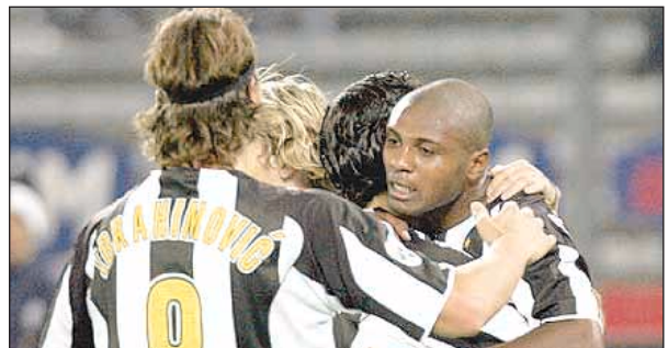
SERVIZI NELLO SPORT