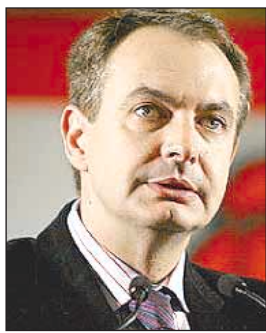
José Luis Zapatero

Parla il premier Zapatero “I vescovi? In Spagna decide il governo”