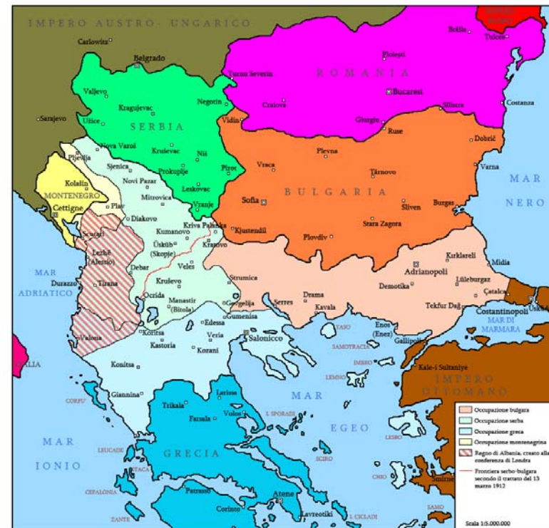
ZONE D'OCCUPAZIONE ALLA FINE DELLA PRIMA GUERRA BALCANICA (APRILE 1913)